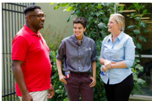
地域社会を反映しているクラブほど、大きく発展できる可能性が高まります。

インクルージョンへのコミットメントを通じて、誰もがリーダーシップを発揮し、ロータリーの使命に貢献できるようになります。そうすれば、成功に必要なリソース、機会、サポートがすべての会員に与えられます。帰属意識の文化を培うことで、地域や世界に持続可能な変化を生み出す会員の可能性が最大限に発揮されます。