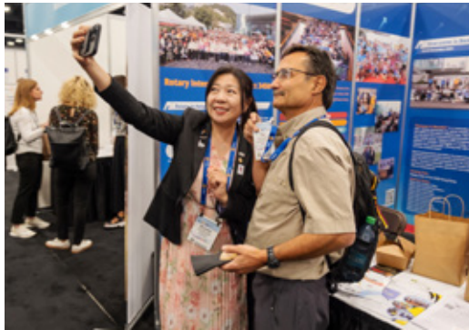
2025年ロータリー国際大会の「友愛の家」では約200のブース展示が行われました。

上記のほかにもロータリーの全ソーシャルメディアチャンネルのリストを参照し、ロータリーのプログラム、グループ、リーダーをフォローしましょう。