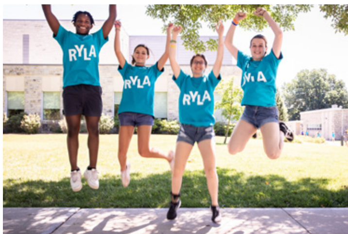
RYLAでは若者が奉仕の価値を学び、リーダーシップ力を身につけます。

毎年、ロータリー青少年指導者養成プログラム (RYLA) を通じて、リーダーシップ育成キャンプやセミナーに多くの若者が参加しています。これらの行事は、クラブ、地区、または多地区合同により開催されます。和やかな環境の中でディスカッションや講演、グループアクティビティに参加し、リーダーとなるために必要なスキルを身につけながら、人間として、また市民として成長する機会となります。RYLAプログラムの内容は参加者の年齢に応じてカスタマイズされます。