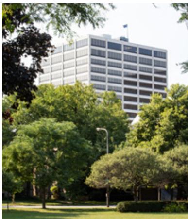
国際ロータリー世界本部（米国イリノイ州エバンストン）

世界各地の国際ロータリー事務局に勤務する800名以上の職員が、会員、クラブ、地区、プログラム参加者、学友をサポートし、効果的な運営を後押ししています。