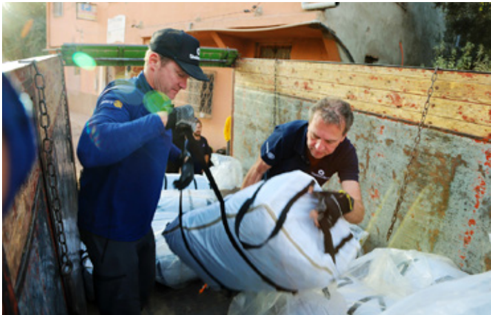
シェルターボックスとロータリー会員は、2023年のモロッコ地震で被災した人びとにテントや緊急物資を提供しました。

ロータリーのパートナーシップの詳細とパートナー団体のリストは rotary.org/partners をご覧ください。