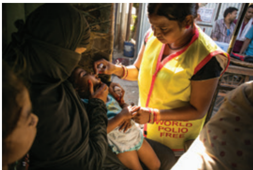
ポリオワクチンを投与するロータリー会員。

ロータリー財団へのご寄付は、地域社会に持続可能な良い変化をもたらすプロジェクトのために活用されます。財団への寄付方法については、クラブの財団委員長に尋ねるか、 rotary.org/donate をご覧ください。ロータリー財団に関する詳細は、「 ロータリー財団参照ガイド 」または ラーニングセンター の「ロータリー財団の基本」のコースをご覧ください。