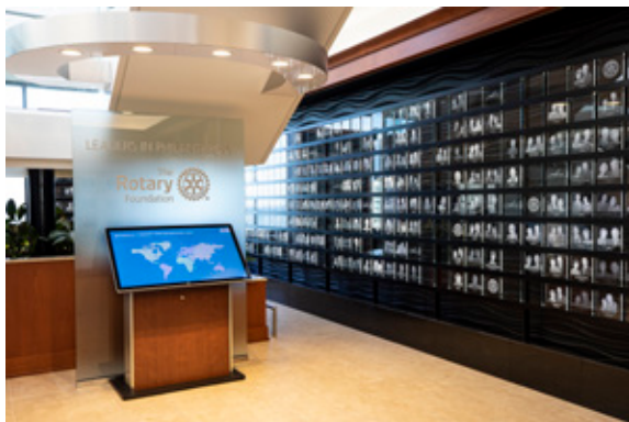
国際ロータリー世界本部17階にあるアーチ・クラフ・ソサエティギャラリー

世界本部は米国イリノイ州エバンストンにあります。この本部ビルは「ワン・ロータリー・センター (One Rotary Center)」と呼ばれ、座席数190の講堂、資料室、RI理事会や管理委員会の会合が行われる会議室、RI会長を含むシニアリーダーの執務室のほか、ロータリーの歴史や未来のビジョンについて学べる展示もあります。平日には無料の館内ツアーも提供されています（事前予約が必要）。詳細とツアーのお申込みは rotary.org/visit をご覧ください。