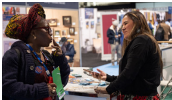
2025年ロータリー国際大会の参加者たち。

ロータリー会員であることの魅力は、国際的な体験を味わい、世界中の仲間とつながる多くの機会が得られることです。海外からの青少年交換学生を受け入れる、国際会議に参加する、海外出張や旅行中に現地のクラブを訪問する、プロジェクトで海外のクラブと協力するなど、さまざまな機会があります。